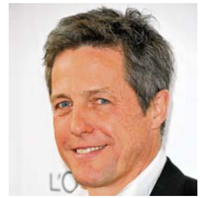
Schauspieler Hugh Grant hätte bei „Bridget Jones 2“ beinahe seinen Text vergessen...