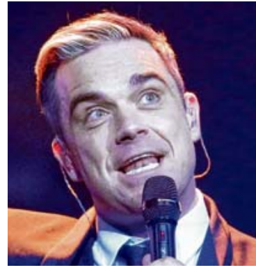
...und sogar eine Rampensau wie Robbie Williams kämpft mit Unsicherheit.