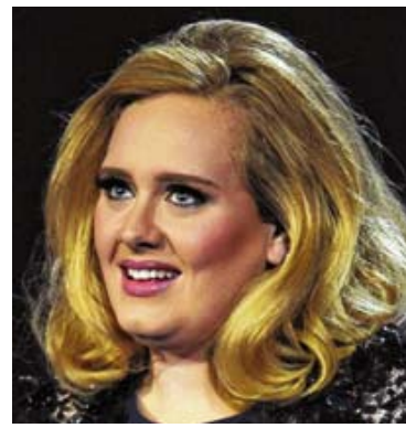
Viele Promis leiden unter Lampenfieber – so etwa die britische Sängerin Adele.