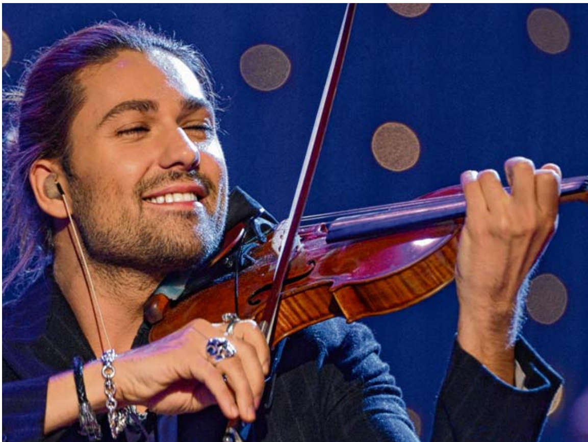
Völlig verzückt: Der deutsche Geigenvirtuose David Garrett kämpft wohl nie mit Lampenfieber.